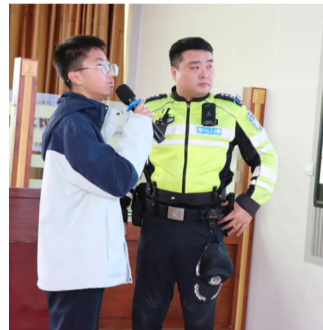
校园里的互动式普法