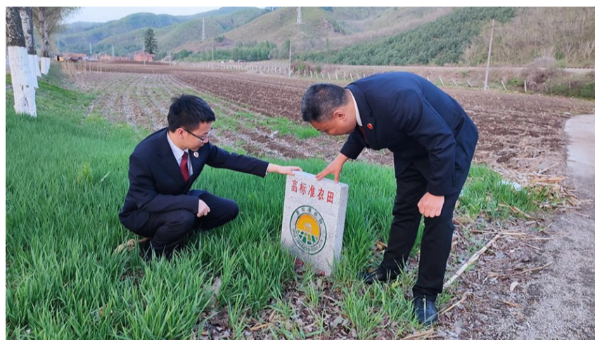
检察官查看高标准农田标志