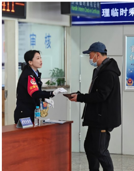
▲民警将遗失物品归还旅客