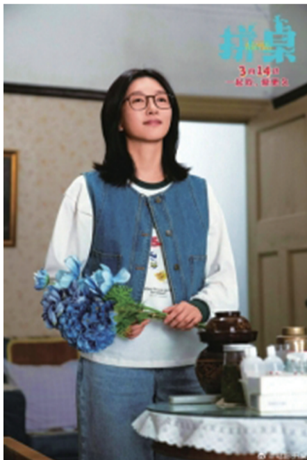
江疏影在电影《拼桌》中诠释图书编辑。