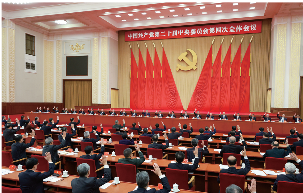
中国共产党第二十届中央委员会第四次全体会议,于2025年10月20日至23日在北京举行。中央政治局主持会议。