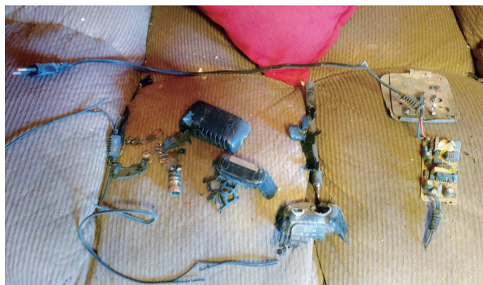
这是9月18日在黎巴嫩巴勒贝克拍摄的爆炸后破损的通讯设备。

17日爆炸的传呼机贴有金阿波罗标签。金阿波罗公司18日称，这批传呼机并非该企业生产，而是授权一家名为BAC的