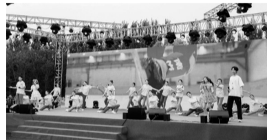
活动现场。

本报讯 记者朱柏玲报道 日前，由共青团沈阳市委员会主办的“青春沈阳 有你最美”沈阳市大学生草地音乐节在沈阳理工大学龙翔体育场举行。旨在为搭建青年与城市对话平台，助力青年发展型城市建设，唱响“青春沈阳”城市IP。