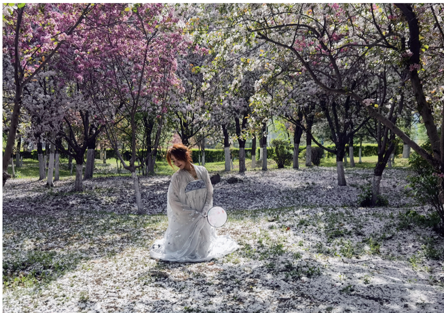
长白岛森林公园吸引不少游人来此赏花拍照。

4月25日,在沈阳市和平区长白岛森林公园内,3000余株樱花、海棠花在浑河南岸为市民及游人铺就一条总长1000米的“花路”, 和平区百花节之最美海棠花节和浪漫樱花节 正式启幕。