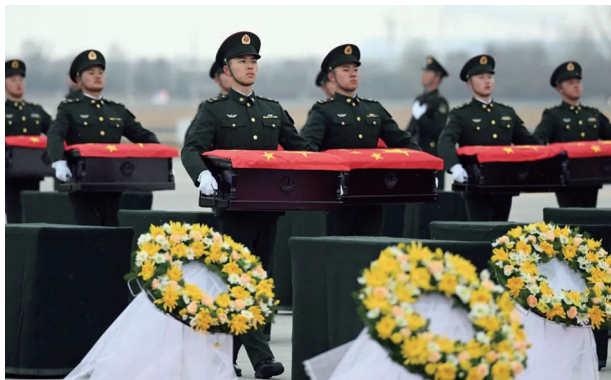
▲25名搬运烈士遗骸棺槨的礼兵按序下机,对棺槨进行整理。