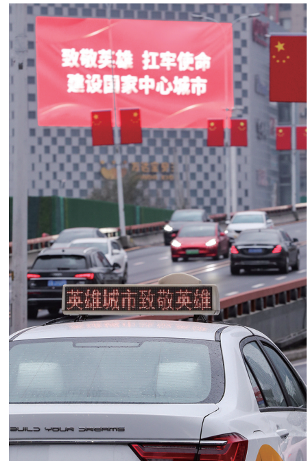
◀在骑警车队护送下,25名在韩中国人民志愿军烈士遗骸的护送车队前往沈阳抗美援朝烈士陵园。