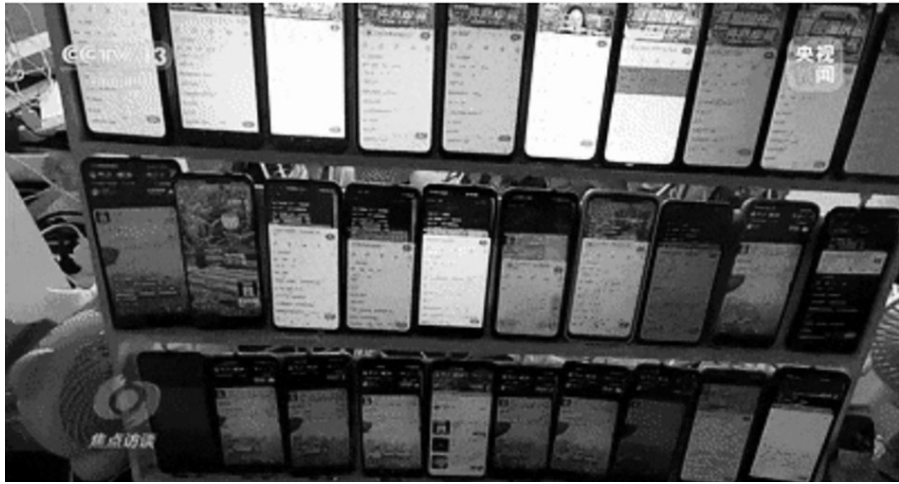
“刷手”一人扮演多个买家角色，同时操作30个号，24小时工作。

“三、二、一，上车！” 消费季来临，各大电商平台开启新一轮促销。伴随着主播的一阵阵吆喝声，直播间的网友开始抢购，仅上线十几秒的商品瞬间成为销售“爆款”，满屏的点赞、好评和用户回购。看到这些，你是不是也心动了?