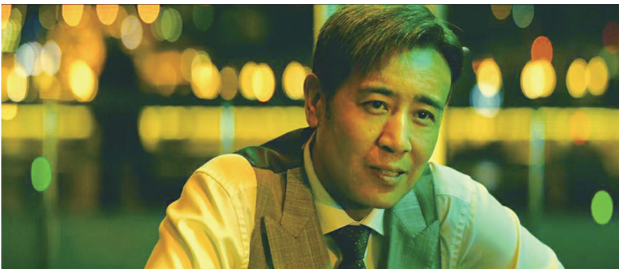
于和伟在《坚如磐石》中的剧照。