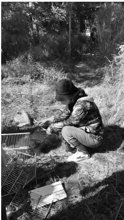
剪毁捕鸟网。 视频截图