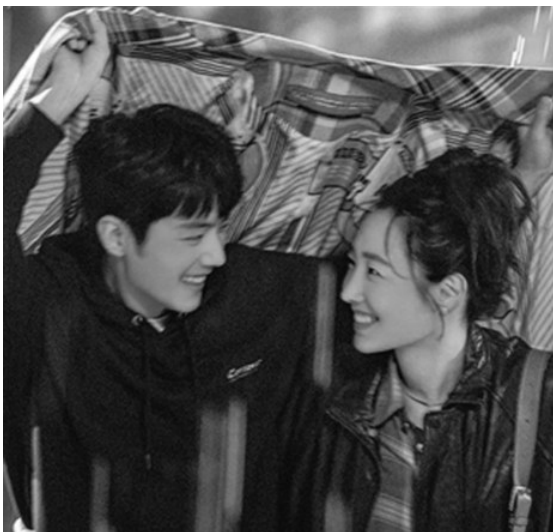
肖战、白百何上演一段相互治愈的“充电式爱情”。