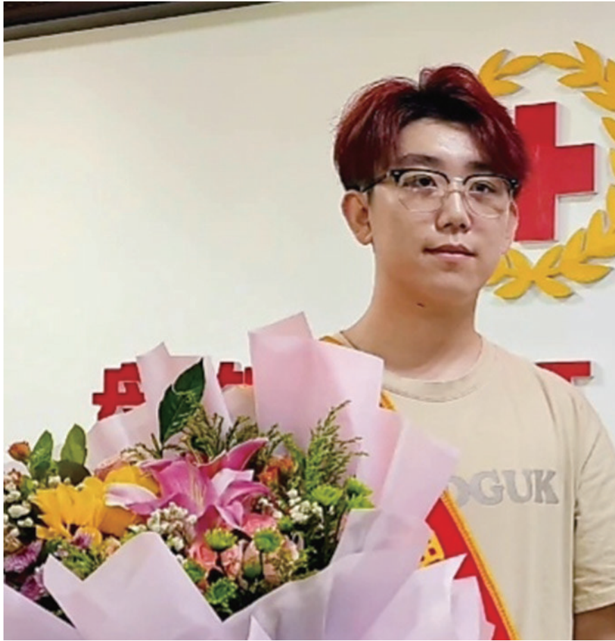
21岁小伙成为盘锦首位“00后”造血干细胞捐献者。