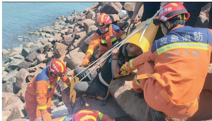
达被困人员身边,在做好安全防护之后,将被困人员牢牢地固定在担架上,在派出所和附近群