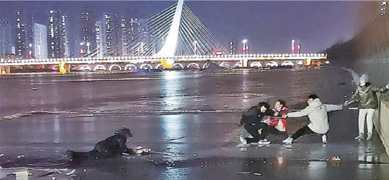
众人合力用树枝将老人拉上冰面。