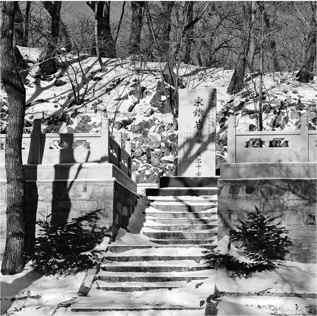
本溪满族自治县和尚帽子山顶的宋铁岩烈士纪念碑。此处山区也是当年抗联一军一师密营地、宋铁岩烈士殉国地。

宋铁岩是我们党在黑土地上一位卓越的政工干部，历任东北人民革命军第一军独立师政治部主任、东北人民革命军第一军政治部主任、东北抗联第一军政治部主任，在部队党组织建设、政治宣传和根据地建设、发动群众上作出了突出贡献。