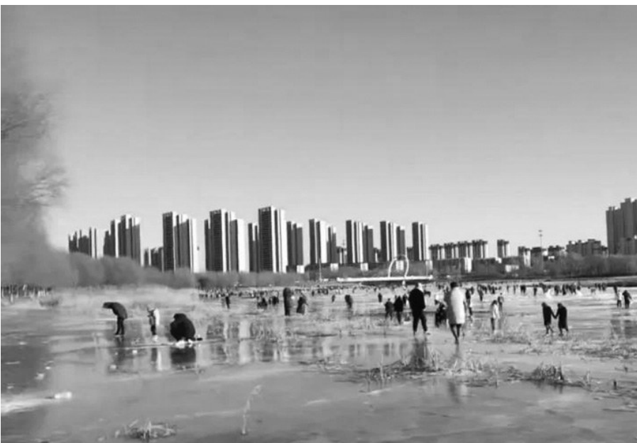
市民在沈北蒲河冰面上“捕鱼”。