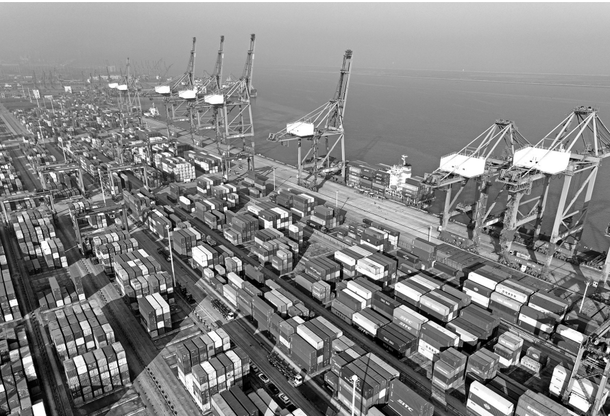
这是12月7日的江苏连云港集装箱码头装卸作业区（无人机照片）。

对外经济贸易大学国家对外开放研究院教授庄芮表示，进入冬季，疫情反复、成本增加以及汇率波动等多重因素，影响了部分企业的外贸积极性和活跃度。在此背景下，我国外贸保持较快增长为稳住宏观经济大盘发挥重要支撑作用。 “这背后，既有宏观层面，各级政府减税降费、增加外贸信贷投放等一系列助企纾困政策举措的落地见效；也有微观层面，我国外贸企业积极修炼‘内功’，通过开拓国内市场、加强技术创新、优化内部管理流程等方式不断增强抗风险能力，提升企业竞争力。”她进一步分析说。 梳理这份外贸“成绩单”发现，前11个月，无论是贸易主体结构，还是国际市场结构、出口商品结构等，都呈现出转型升级、持续优化的态势。 从外贸主体看，全国有进出口实绩的民营企业同比增加7.3%，合计进出口19.41万亿元，同比增长13.6%，占同期我国外贸总值的50.6%，比去年同期提升2.2个百分点，继续发挥外贸