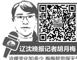
冷暖变化知多少 梅梅帮您探天气