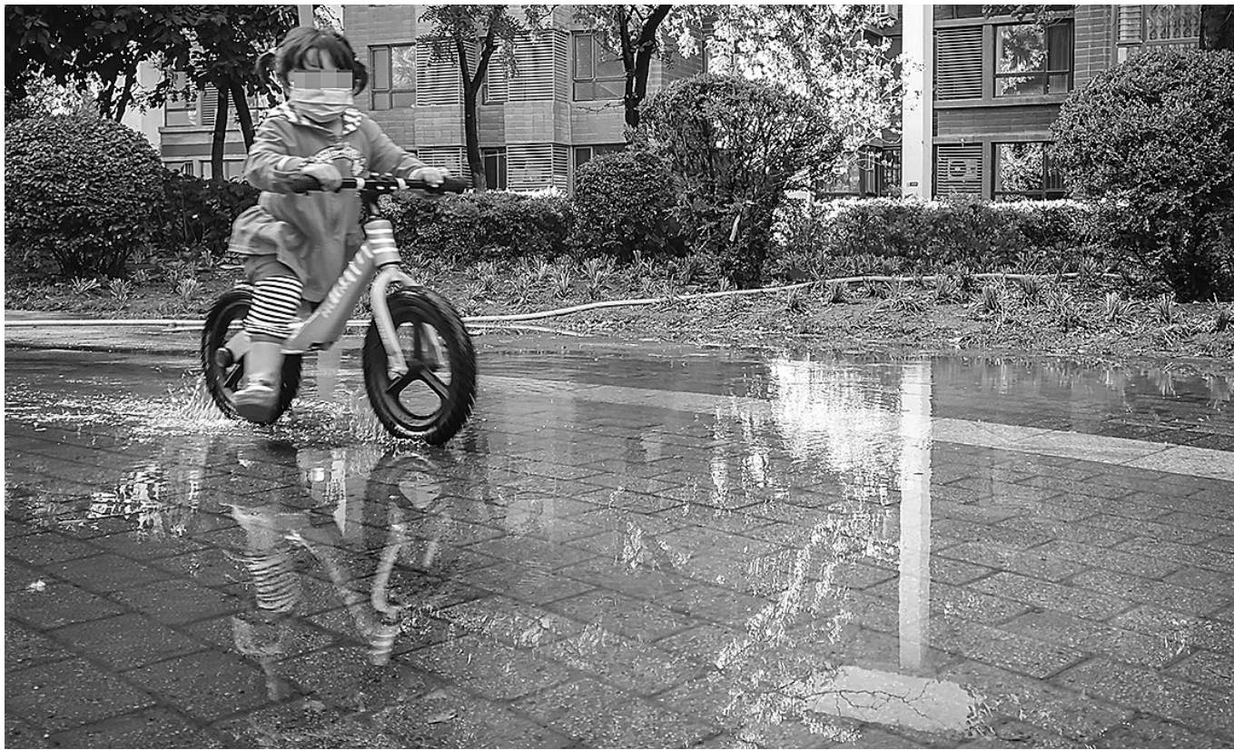
园区里一名穿雨靴的小女孩在积水中骑车。