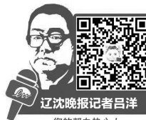
辽沈晚报记者吕洋 您的帮办热心人