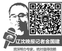
辽沈晚报记者金国建 资深帮办专家,绝对值得信赖