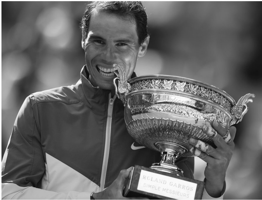
6月5日，纳达尔在颁奖仪式上手捧冠军奖杯。