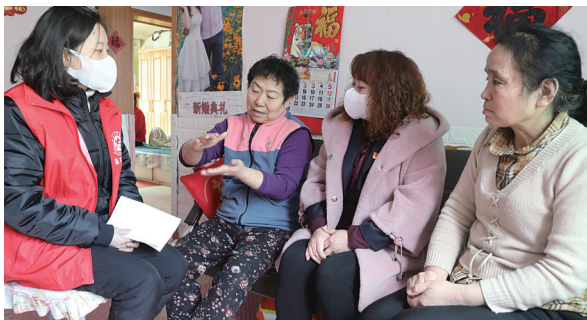
志愿者到居民家里了解需求。