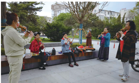
年底前，沈阳市大东区将实现“两邻”基层治理全覆盖。

以大东区北苑社区为例，社区不把就业工作局限在社区本身，更积极承接大北地区，乃至大东区、沈阳市的就业服务工作，通过整合资源，用最小细胞发挥最大效能。居民走进社区就可以通过“立体柱”“一体机”“宣传角”等信息化设备，立即查询全市范围内的招聘岗位信息、用工政策等。以“真心的就业服务、安心的就业保障、暖心的技能培训、贴心的政策帮扶、放心的就业岗位”满足居民就业需求。