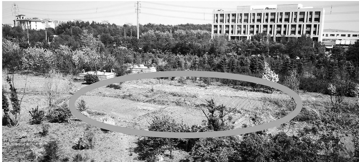
绿地内被种上各种蔬菜。