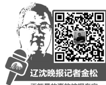
辽沈晚报特派本溪主任记者金松 正能量故事的挖掘专家

后来,王女士的二姐到了北京。王女士毕业后到了大连,父母也都搬到大连和她生活在一起。“2016年的时候,母亲给二姐打电话说了我们还有个大姐的事。之前父母找大姐我们都不知道,可能是他们年纪大了,我们也都成家立业、生活稳定,觉得我们有能力帮他们寻找了,这才告诉我们。” 王女士说,2016年年末的时候,一家人回丹东找大姐,母亲的叔叔已经去世,没有留下任何线索;八道沟医院当初的老院长也已经去世。王女士等找到了老院长的女儿,“她知道这件事,提供了几名老护士的联系方式,也提供了部分线索,但是没有具体信息。” 王女士说,根据这些信息,他们也找到了有相似情况被送人的女孩,但都不是自己的大姐,“有一位照片和我们姐妹很像,可是做了DNA没对上。” 2017年七八月份两位老人又回了一趟丹东,从那以后因为没有新的线索,就再没回去。王女士说,“去年父亲去世了,临走还念着大姐。母亲这段时间更是因为思念大姐,常常以泪洗面。这让我更希望能早日找到大姐了。” 王女士告诉记者,现在家里生活还比较宽裕,寻找大姐没有什么别的诉求,也不会给大姐家庭增加什么负担,就是母亲想好好看看女儿,她和二姐也想看看这个从未见过的大姐,“看看她过得怎么样,毕竟她现在也近50岁了。” 辽沈晚报特派本溪主任记者 金松