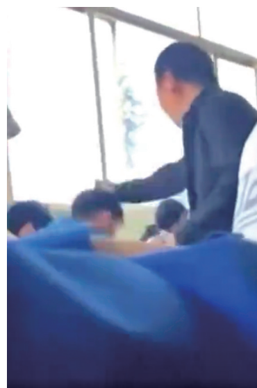
网传视频中,老师打人瞬间。 视频截图

日前,云南省昭通市鲁甸县一学校教师殴打学生的视频引发社会关注。对此,鲁甸县政府新闻办公室22日发布通报,根据调查结果和相关规定,已对相关责任人员和单位作出处理,给予涉事教师降低岗位等级处分,并调离教师岗位。当地正组织全县所有学校深入开展师德师风教育。