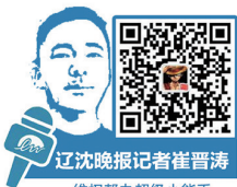
辽沈晚报记者崔晋涛 维权帮办超级小能手