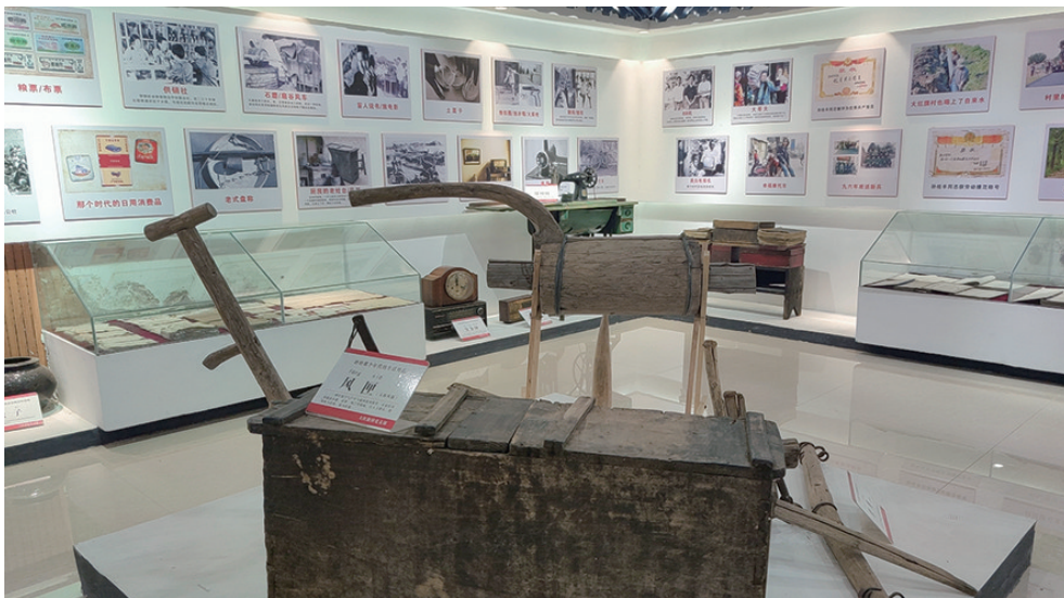
在鞍山市台安县西佛镇大红旗村的村史室里，一件件满是岁月痕迹的老物件记录着村子的历史。