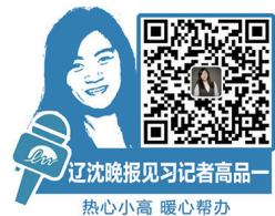
辽沈晚报见习记者高品一 热心小高 暖心帮办