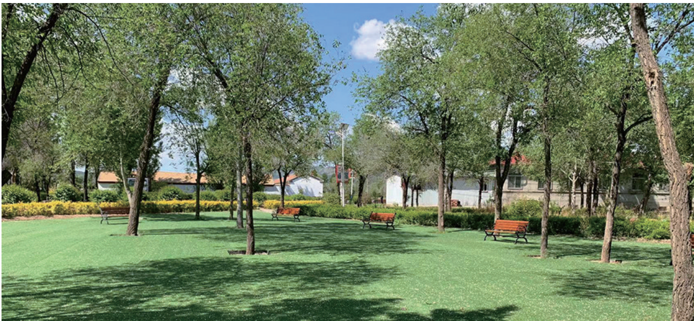
为提升乡村颜值，宋杖子镇近年来一直在整治人居环境。

农业作物主要有玉米、小麦、高粱、大豆、谷子等，是全国闻名的“蔬菜之乡”。宋杖子镇下辖14个村，127个村民组，3.2万人口。