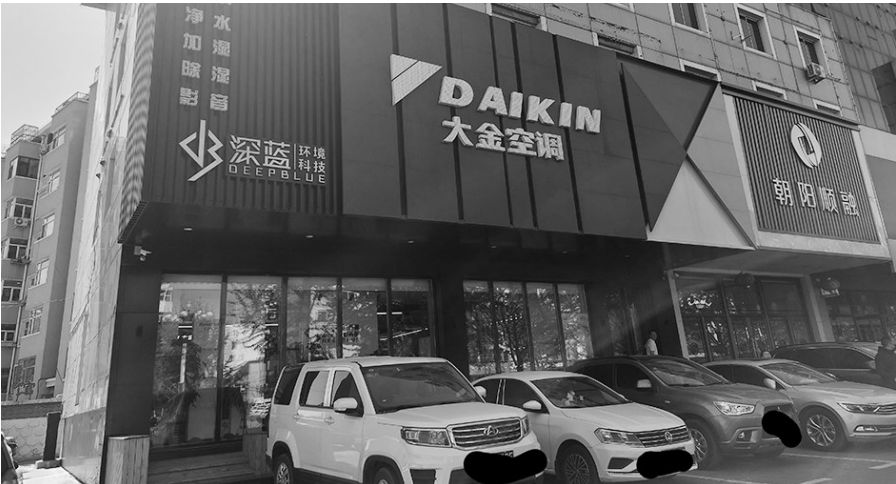
刘先生在这家名为深蓝科技的店面购买的空调。

2020年8月,刘先生在朝阳市一家名为“朝阳深蓝室内环境工程有限公司”(以下简称朝阳深蓝科技)的商业网点花费4万余元购买了一款“大金”中央空调。同年12月,空调安装完毕。2022年2月,待房屋整体装修完工后,刘先生要求安装空调面板时,才发现空调机箱的型号与当初自己购买的型号不一致,“比我当初购买的价格要低,不是一个系列。” 2022年4月26日,刘先生向辽沈晚报记者介绍,目前安装在自己家中的“一拖四大金中央空调”为VRV-B系列机型,“并不是我当时约定购买的可以安装黑奢智能导风板的VRV-P系列机型。并且,四个内机中还有一个内机与其他三个内机型号不一致,为更低端早已停产的机型。与官方客服电话求证,得知该款机型为活动套餐机型,不能与其他机型搭配,否则将会引起运行故障,不能正常使用。” 刘先生购买P系列,送的B系列,而且即便是B系列的4个内机还掺杂了同系列的另一款内机,问题出在哪里? 记者看到刘先生的合同中对于机器型号只是用简单的数字标注,“外机140,”“71”“45”“32”“32”,并未见到VRV-P以及VRV-B字样。 对此,刘先生表示当初与对方谈的时候提出要买能够安装“黑奢导风板”的这款,而能安装“黑奢导风板”的机型只有VRV-P系列。 “送货的时候你没检查吗?”记者问刘先生。 “2020年12月18日,我接到装修公司监理