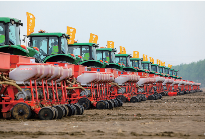
安装了自动驾驶导航系统的春耕车辆。