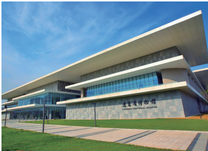
辽博风物——辽宁省博物馆