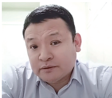
“小记课堂”云上线,专家、记者们与小同学线上互动。

3月中旬,辽沈晚报成长学院的小记者团正式发布“招募令”,2022级小记者的招募引来了不少对此感兴趣的小同学,在短短几天内就收到了千余份申请,400余位小记者正式入团。同学们对小记者团的探班顶流剧团、深度了解文化科技场馆、做盛京公益志愿者等各种既能锻炼能力又能增长见识的活动,十分期待。