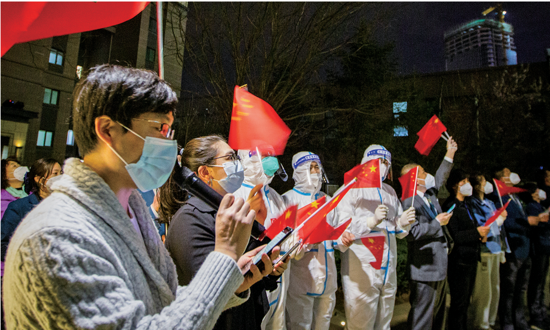
4月13日19时30分,在沈阳中海和平之门壹里园区,社区、物业工作人员与小区居民同唱《我和我的祖国》。