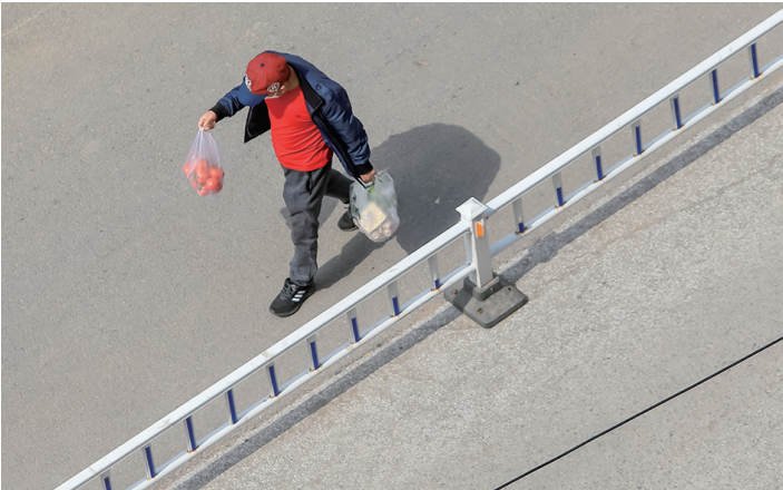
防范区居民在遵守防疫政策的前提下采买生活必需品。