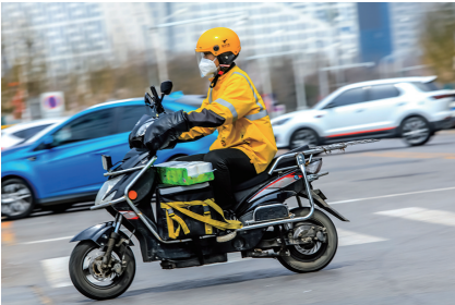
外卖小哥在送货路上奔忙。