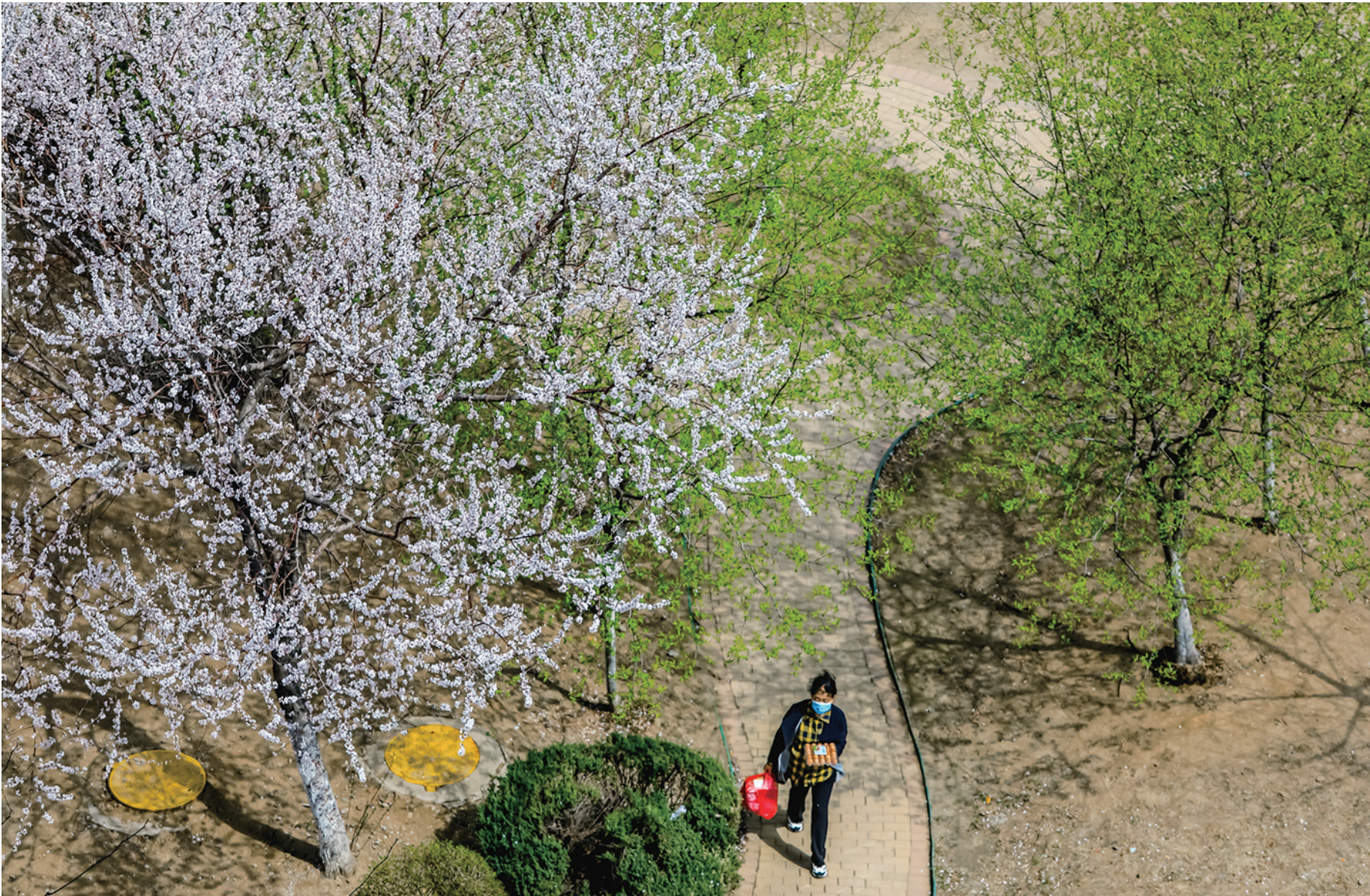
春风送暖，枝头已满是桃花，与绿树相映成美。