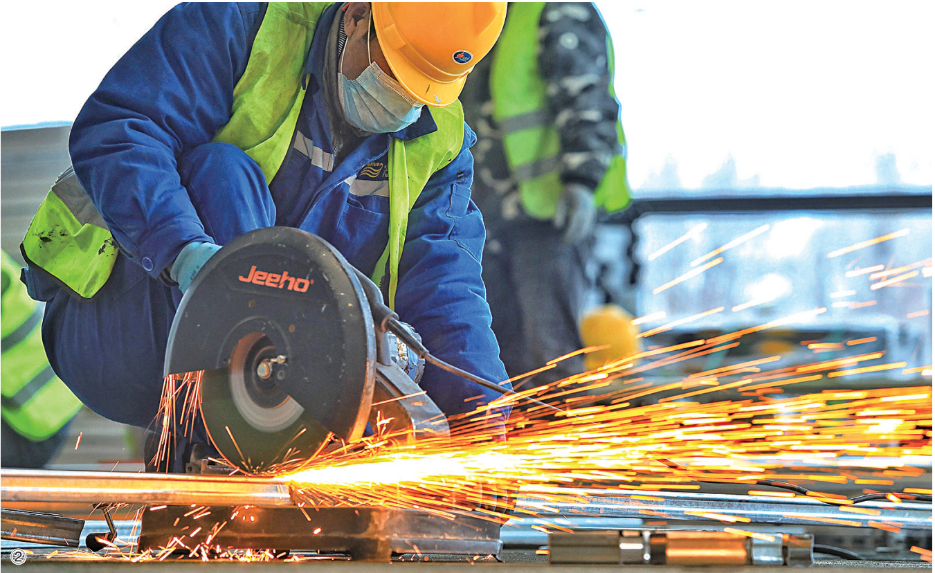
图①3月22日晚,沈阳方舱医院和健康驿站工程现场灯火通明,建设正在推进中。 图②工人们正在进行切割作业。 图③进入工地内的车辆和物料都要经过消杀处理。 图④工人们正在有序地进行舱内基本设施建设施工。 图⑤工人们正进行舱内吊装施工。 图⑥部分设施已经搭建出雏形。