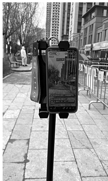
“居民们点点关注,实时掌握核酸检测现场排队人数。”物业志愿者正在通过手机向广大居民直播核酸检测现场排队情况。

“参加核酸检测,我就担心排队。昨天在业主群里看到核酸检测点可以云直播,早上8点我就开始关注,发现这里人不是很多,就马上过来了,从登记到采样就几秒钟,效率杠杠的!”居民刘先生。 张皖 辽沈晚报记者 王月宏