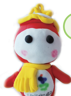
阳光灿灿幼儿园 韩梓萱 6岁