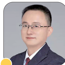
骨性关节炎病友圈

马旭 :主任医师,医学博士,沈阳市骨科医院关节外科副主任,辽宁省骨关节病重点实验室副主任,从事骨科临床和科研工作二十余年。擅长髌膝关置换以及复杂骨折的治疗。