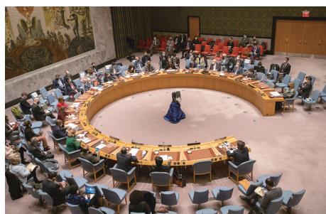
2月21日,在位于纽约的联合国总部,安理会举行审议乌克兰问题紧急会议。

中国常驻联合国代表张军21日晚在安理会举行的审议乌克兰问题紧急会议上发言,呼吁有关各方保持克制,通过外交努力为乌克兰问题寻求合理解决方案。