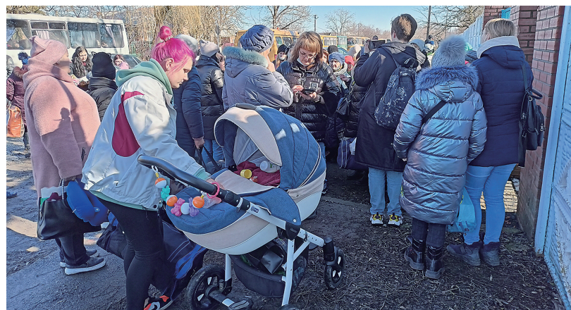
2月19日,乌克兰东部难民抵达俄罗斯南部罗斯托夫州的一处临时安置点。

俄罗斯总统普京21日签署命令,承认乌克兰东部的“顿涅茨克人民共和国”和“卢甘斯克人民共和国”,随后命令俄罗斯部队在这两个“共和国”维和和平。