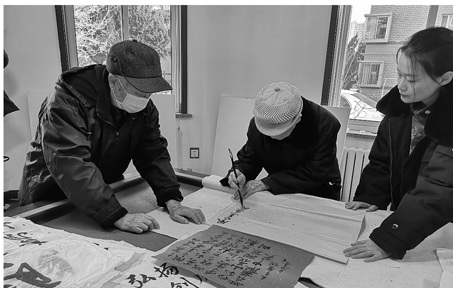
离退休老干部挥毫泼墨,献上各抒情怀的作品。