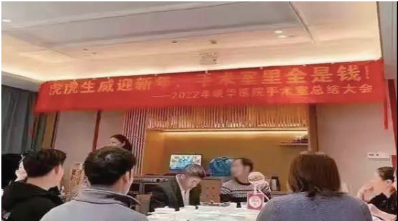
网传“手术室里全是钱”的医院年终总结大会图片。

因网传“手术室里全是钱”的年终总结大会图片,东莞康华医院被网友热议。1月27日,该医院发布说明,称该条幅是院内护士自行制作,用在该院手术室部分人员自发组织的聚餐中。对此该院郑重向社会道歉,并第一时间对相关责任人进行严肃批评教育。