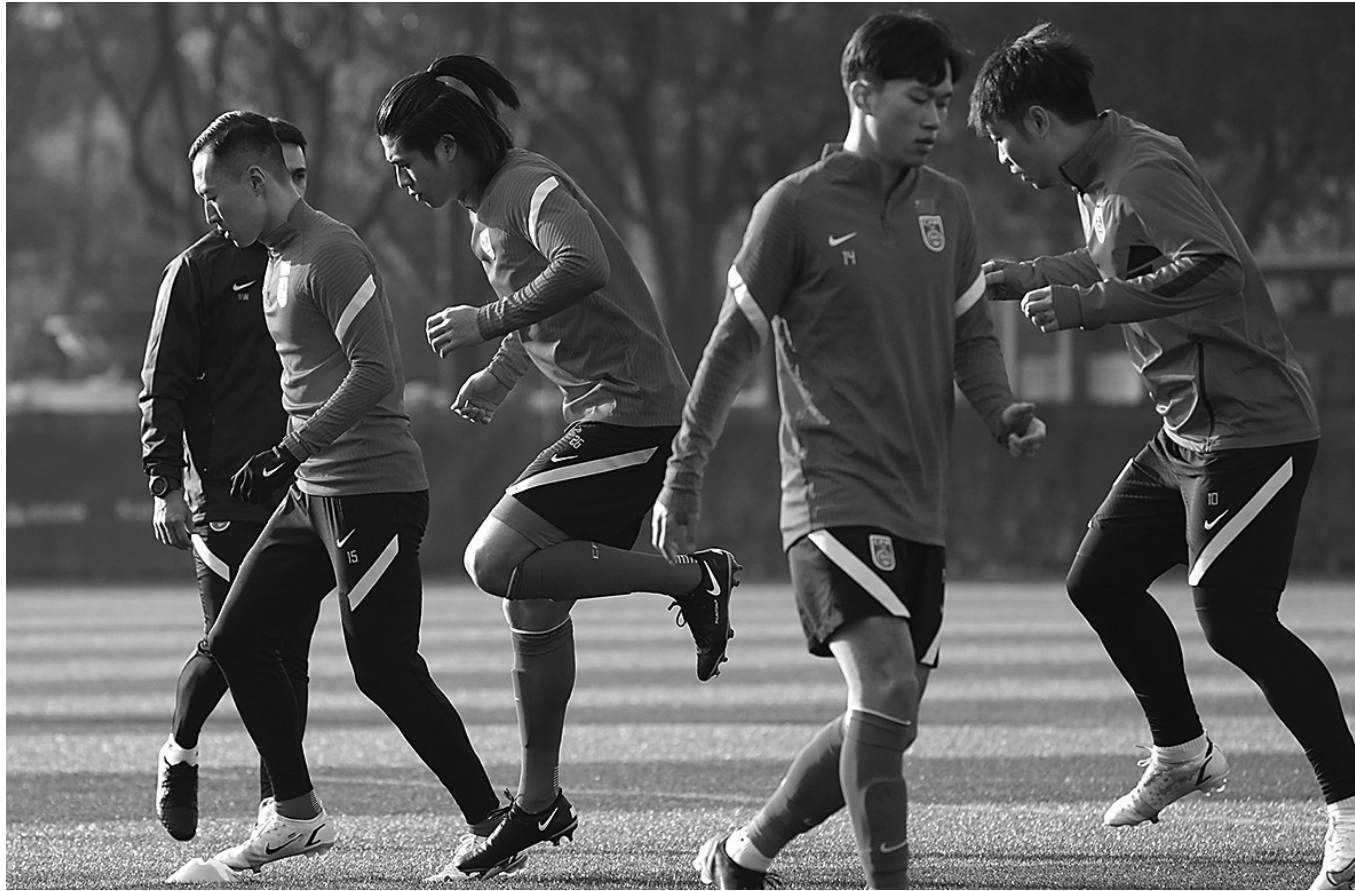
国足球员在进行训练。