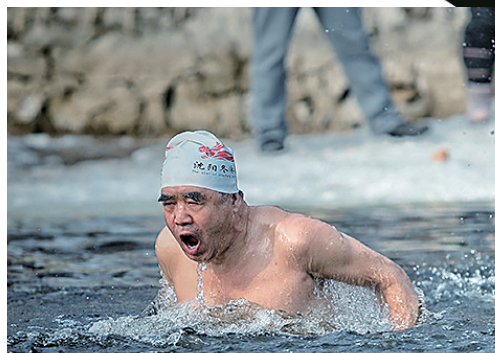
冬泳健将劈波斩浪。