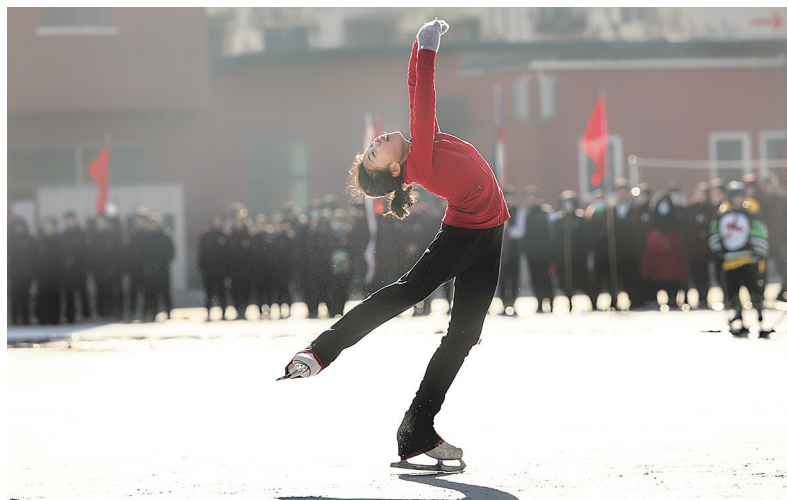
► 花样滑冰走进中小校园。