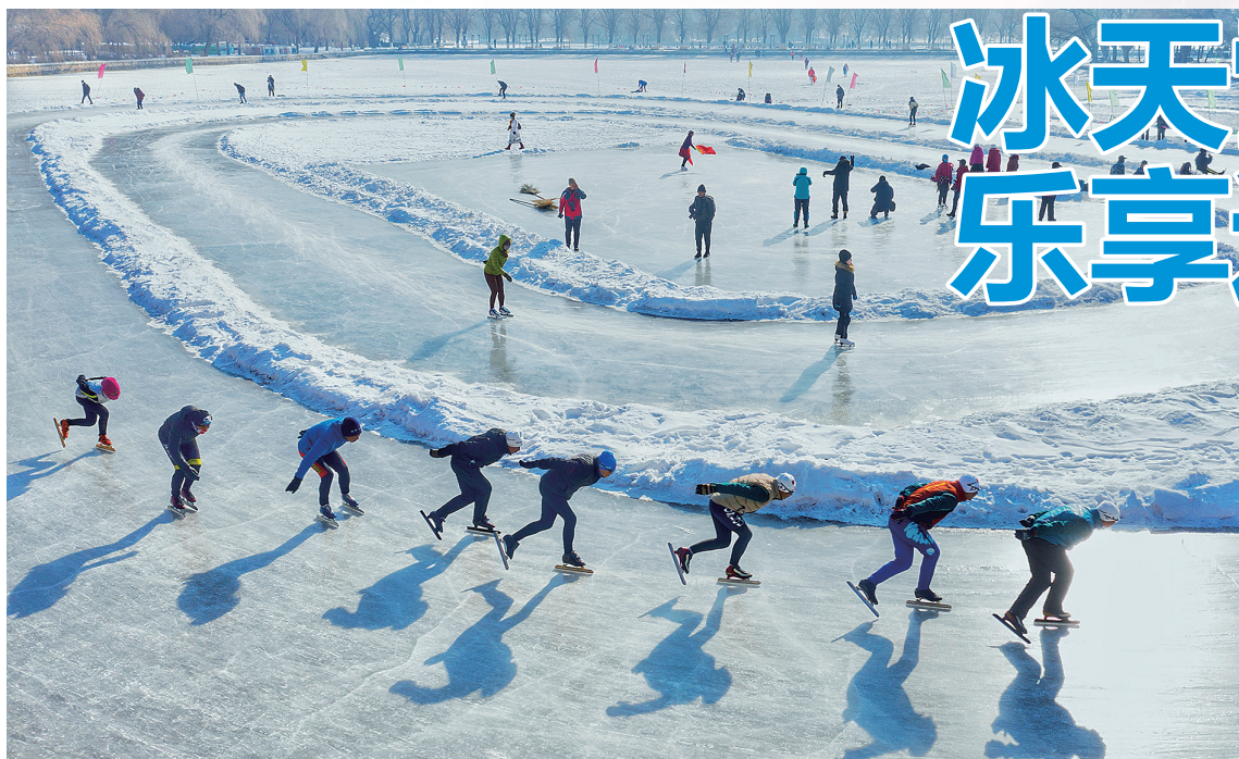
沈阳北陵公园冰场,速滑爱好者飞驰的身影成为冬日里的一道风景。