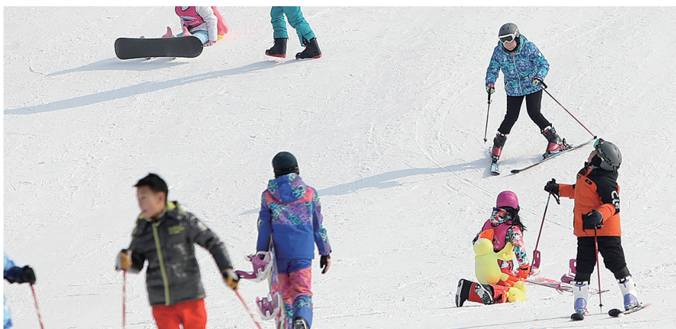
许多小朋友在很小的年龄就加入到滑雪运动的行列。