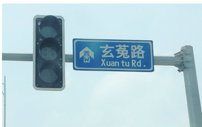
沈阳浑南区的玄菟路路牌。

据考古学家判定,并结合相关史料可知,魏晋两汉时代著名的辽东玄菟郡,这“玄菟”二字居然与猛虎有关。“玄”,黑色,《说文》注为“黑而有赤也”,中国古代传说中有玄水之说,泛指北方的水。“玄菟”,有学者分析是黑虎的意思,即史学界所称的“黑虎说”。不过,玄菟其实并不一定就指黑虎,东北虎的花纹有黑白黄三色,黑也可以理解为东北虎额头上“王”字花纹的颜色。“玄”无论理解为黑色,还是理解为指向北方,都明显标注了虎的特点或所处方位。汉武帝平定古辽东后,新设立了玄菟、真番、临屯、乐浪四郡,以捍卫边疆,这里的“玄