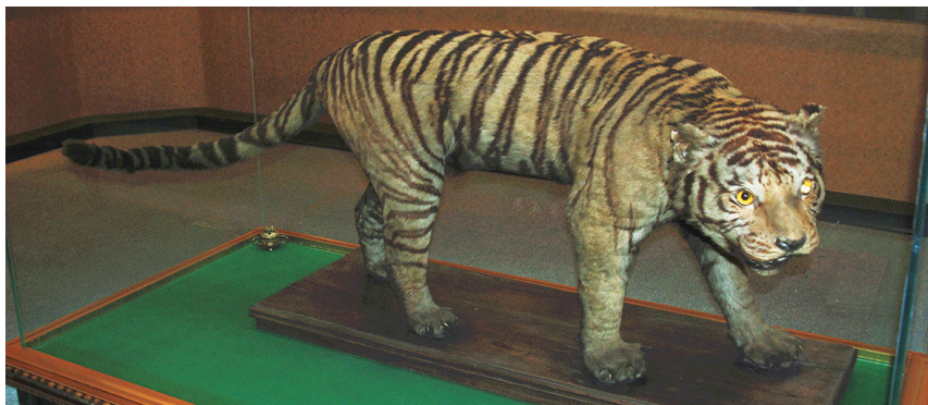
沈阳市同泽女子中学保存的老虎标本。

1929年,张学良将一只东北虎标本送给了当时的同泽中学,现在的沈阳市同泽女子中学。