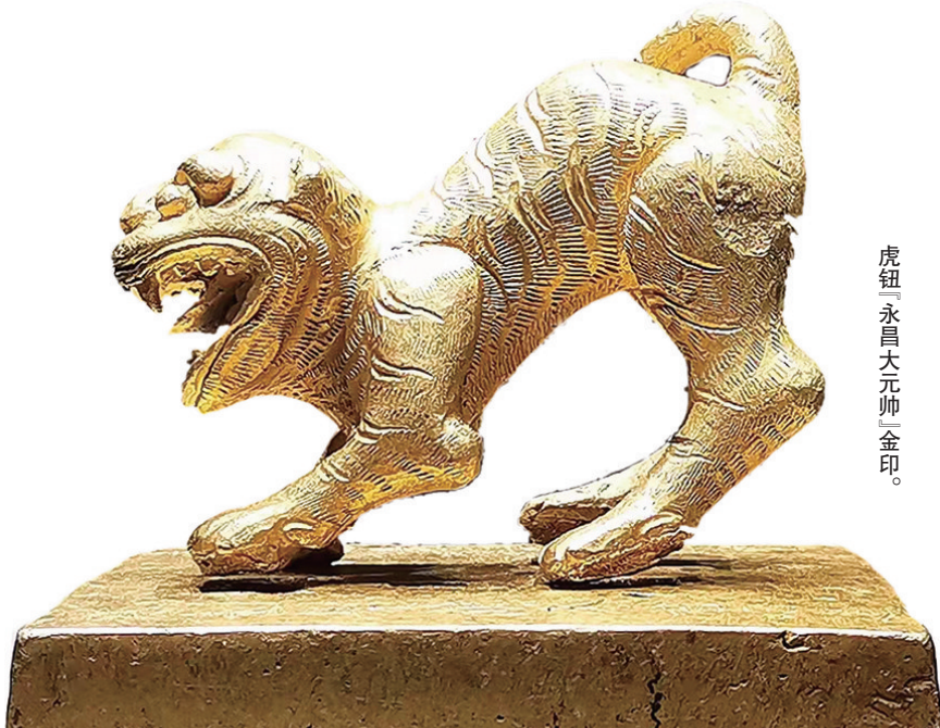
虎钮“永昌大元帅”金印。