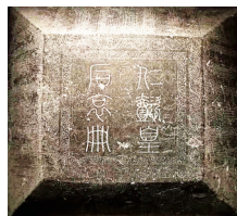
辽兴宗仁懿皇后萧挞里哀册盖石。

元代脱脱在《辽史》中这样评价包括萧挞里在内的大辽皇后：“性宽容，姿貌端丽(萧挞里)”、“仁慈淑谨，中外感德(萧挞里)”、“辽以鞍马为家，后妃往往长于射御，军旅田猎，未