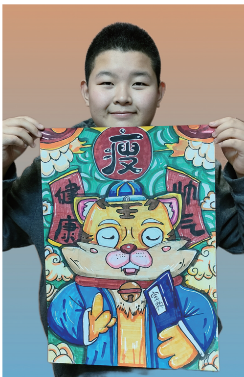
作者:周熙善 12岁 文化路小学

作品简介 《虎年愿望》:采用马克笔作为工具进行新年插画设计,借此祝愿大家心想事成,祖国繁荣富强。