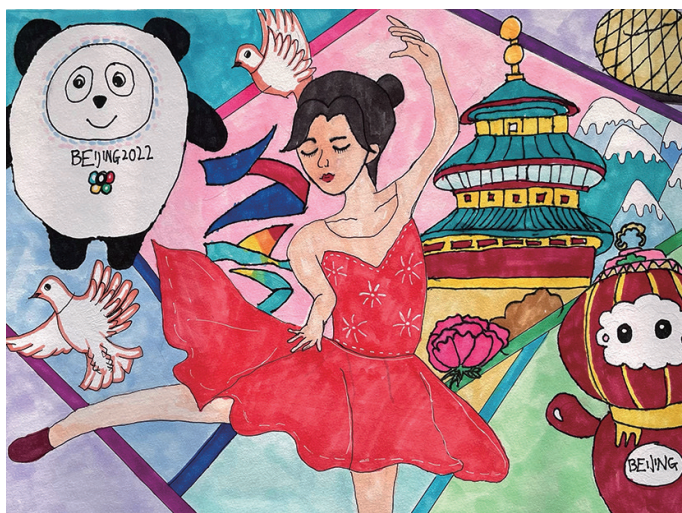
作者:杨佳璇 勤望小学云峰分校虹桥校区

指导教师 宋老师:画面饱满,用色大胆浓郁,色彩搭配和谐,人物形象生动有趣,大小比例均衡,主题鲜明。