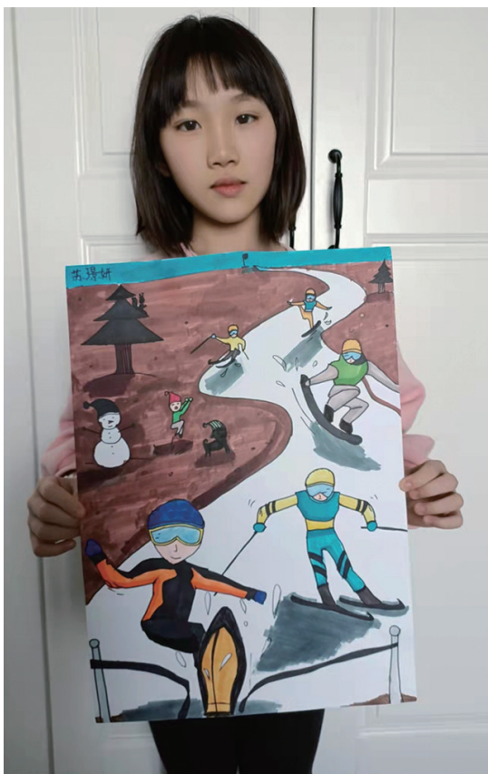
作者:苏璟妍 8岁 二经二小学

作品简介 《滑雪场》:我最喜欢的就是滑雪,我的家乡沈阳也有许多滑雪场,每到冬天,都会和朋友一起去滑雪。