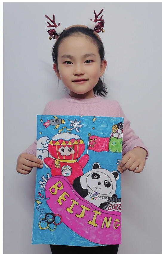
作者:陈刘翰桥 6岁 建平县机关幼儿园

向本报投稿的行为,视为授权本报可以对作品进行推广、宣传、展示、设计衍生产品并进行销售。