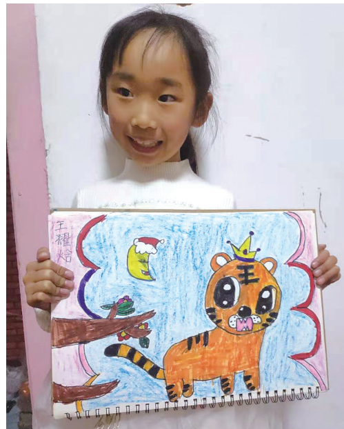
作者:王耀焯 沈河区文艺二小学

向本报投稿的行为,视为授权本报可以对作品进行推广、宣传、展示、设计衍生产品并进行销售。