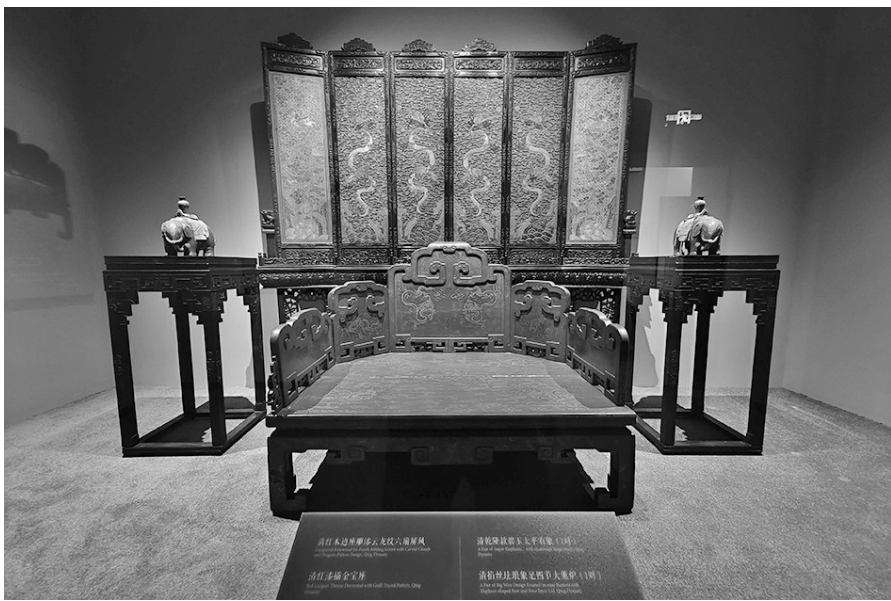
清红漆描金龙宝座。

清代箭通常用柳、杨、桦、榆木做箭杆,杆的顶端加镞,括的部分(箭的上端)剪雕鹤翕,用胶粘上,叫箭羽,羽间亲王至长子写上爵位,贝勒以下至官兵则写上衔名,装弓的袋叫鞬,装箭用的叫囊,满语称之为“撒袋”。囊(gāo)鞬则是藏箭和弓的器具。清弘历御用桦皮弓、“清嘉庆帝行围囊鞬”这两件文物正在沈阳故宫常设展览“清帝东巡