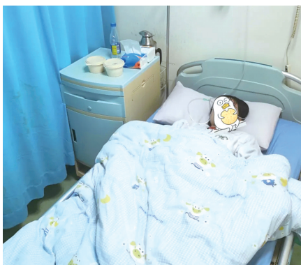
孕妇情况稳定。 据新华社

截至1月9日12时许，这条4个字的回复已收到2.4万点赞。相关话题也冲上了热搜。