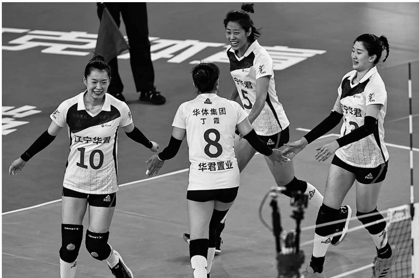
辽宁队球员在比赛中庆祝得分。