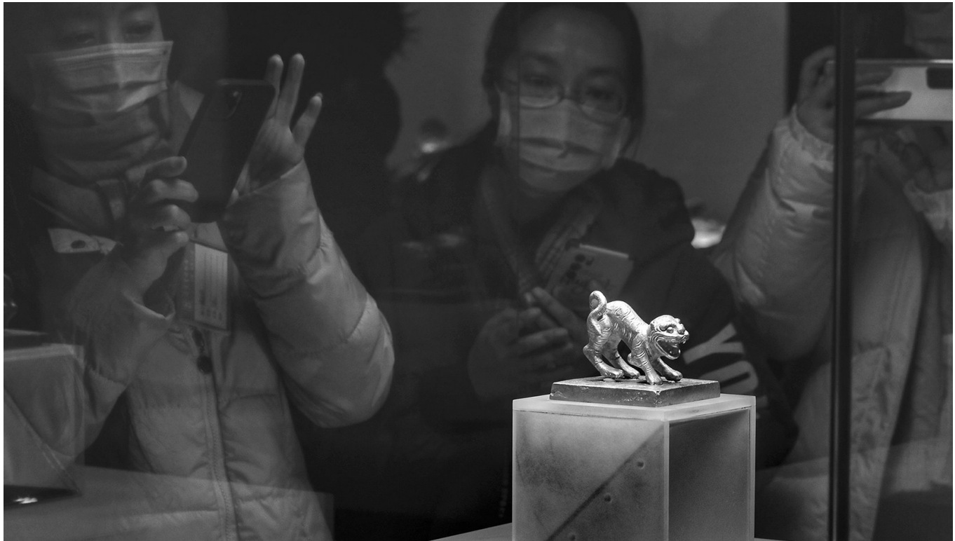
虎钮永昌大元帅金印。

大西政权建立后，与明朝地方武装发生多次战斗。1646年，张献忠迫于清军和南明军队的夹击，率军乘坐满载金银的数千艘木船，从成都沿府河（又称锦江）南下撤离，与明将杨展在彭山县