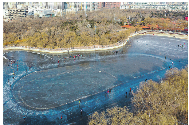
铁西区劳动公园户外冰场是冰友的乐园。